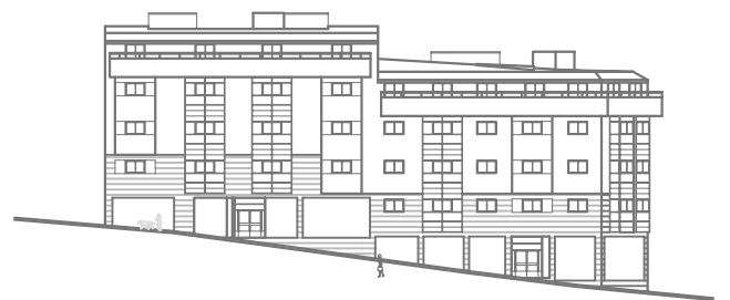
PORTALES 1 Y 2.

MEDIDAS APROXIMADAS Estos planos pueden sufrir variaciones por motivos de índole técnico