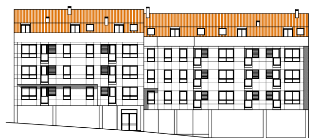
ALZADO A C/ LLORENTE

Plantas 2ª y 3ª Vivienda H S. const.: 48.48 m2 S. útil: 42.05 m2